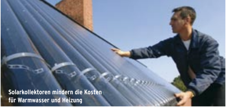
Solkollektoren mindern die Kosten für Warmwasser und Heizung

ohne seine eigentliche Funktion zu erfüllen. Das ist zum Beispiel im Bereitschaftsbetrieb (Stand-by) der Fall oder wenn das Gerät nur vermeintlich ausgeschaltet ist – wie bei einigen Halogenleuchten, deren Netzteile weiterhin am Stromnetz hängen und Strom ziehen. Manche Geräte können auch gar nicht ausgeschaltet, sondern nur heruntergeregelt werden: Sie verbrauchen unbemerkt und ungenutzt 24 Stunden täglich Strom. Die Leerlaufverluste kosten Privathaushalte und Büros jährlich insgesamt rund vier Milliarden Euro. Dies entspricht rund 22 Milliarden Kilowattstunden – mehr als die Städte Berlin und Hamburg zusammen verbrauchen oder zwei Großkraftwerke wie die Kernkraftwerke Brokdorf und Biblis-A pro Jahr produzieren.