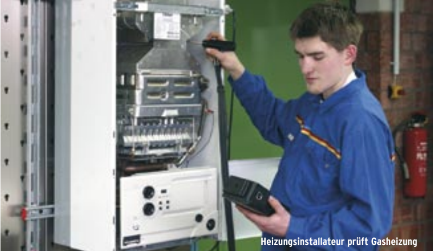
Heizungsinstallateur prüft Gasheizung

Ergebnis ist gleich: weniger Energieverbrauch. Die Energieeffizienz lässt sich in erster Linie durch effizientere Technik steigern. Doch effiziente Technik allein hilft nicht – alle können aktiv werden und Energie einsparen: Der Kühlschrank muss nicht größer sein als nötig oder mit arktischen Temperaturen laufen, und überheizte Räume sind oft sogar ungesünder.